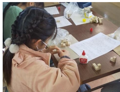
作って遊べる 「立体パズル」