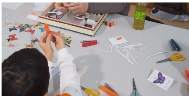
あら不思議! 羽が動く 「パタリンチョウ」