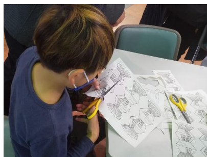
頭をスイングすると 「動く町並み」