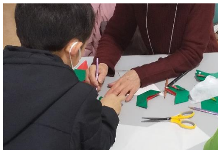
とてもかわいい 「カップちゃん」