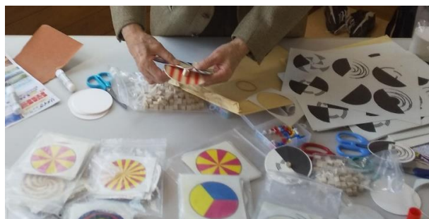
白黒なのに色が見える 「ベンハムのコマ」