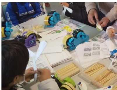
なぜもどってくるのか 「ブーメラン」