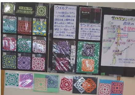
これはステキ 「切り紙紋様」